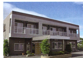
有料老人ホーム グッドライフ

整骨院事業で培ったノウハウを活かし、新たに介護整体を取入れた3時間で心と体を元気にする機能訓練特化型デイサービス。「最期まで自分のことは自分でしたい」「最期まで人に迷惑をかけたくない」万人共通の願いを実現するために「寝たきりにしない」をテーマに開発されました。