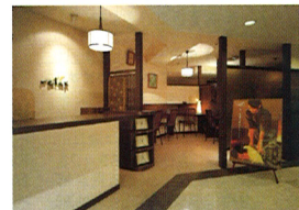
リラクゼーションサロン リラックス

温かい家庭的な「人と人とのふれあい」を大切に考え、身体的なリハビリはもちろん、のんびり楽しむこと、一緒に笑えること、心からげんきになっていくことを目的としています。地域と連携し、その土地に根付いた施設を築き上げていきたいと思えます。