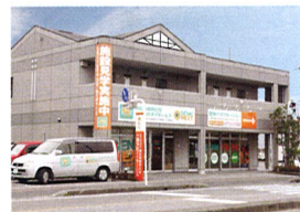
機能訓練特化型 デイサービス GENKI NEXT

肉体と精神の調和を重視し、健康管理と治療をしようとする考え方をホリスティック医療と呼び、新しい医療法として近年注目されています。技術や知識だけではなく、患者さんを「心で診る」ことで、地域住民の皆様に安心してご利用いただける治療を目指しています。